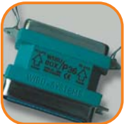
WIBU-BOX/P36 für die parallele Schnittstelle (LPT) von NEC PCs. Artikel-Nr. 3006-01