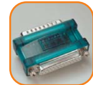
WIBU-BOX/RP & /RP+ Lite-Variante der WIBU-BOX/P für die parallele Schnittstelle (LPT) von PCs. Artikel-Nr. 3007-01 Artikel-Nr. 3007-06