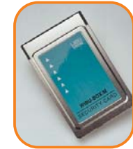
WIBU-BOX/M PCCard für Notebooks und PCs mit PCMCIA Steckplatz. Artikel-Nr. 3020-01

WIBU-SYSTEMS bietet Seminare für Kunden und Interessenten an, um den Einstieg in bzw. den Einsatz von unseren Produkten zu erleichtern. Preise und Termine unter www.wibu.de .