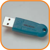
WIBU-BOX/U & /U+ für die USB-Schnittstelle von PCs und Macs. Artikel-Nr. 3031-02 Artikel-Nr. 3031-06