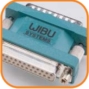
WIBU-BOX/P & /P+ für die parallele Schnittstelle (LPT) von PCs. Artikel-Nr. 3001-05 Artikel-Nr. 3001-06