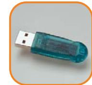
WIBU-BOX/RU & /RU+ Lite-Variante der WIBU-BOX/U für die USB-Schnittstelle von PCs und Macs. Artikel-Nr. 3032-01 Artikel-Nr. 3032-06